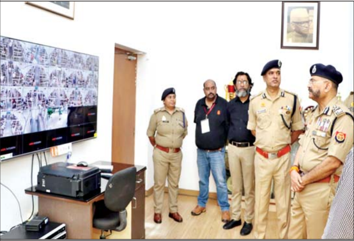
विशेष संवाददाता (vol)