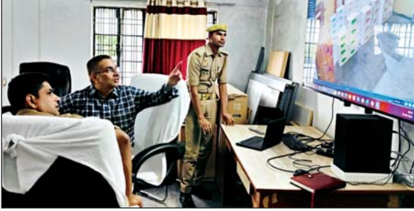
एवं एसपी डा0