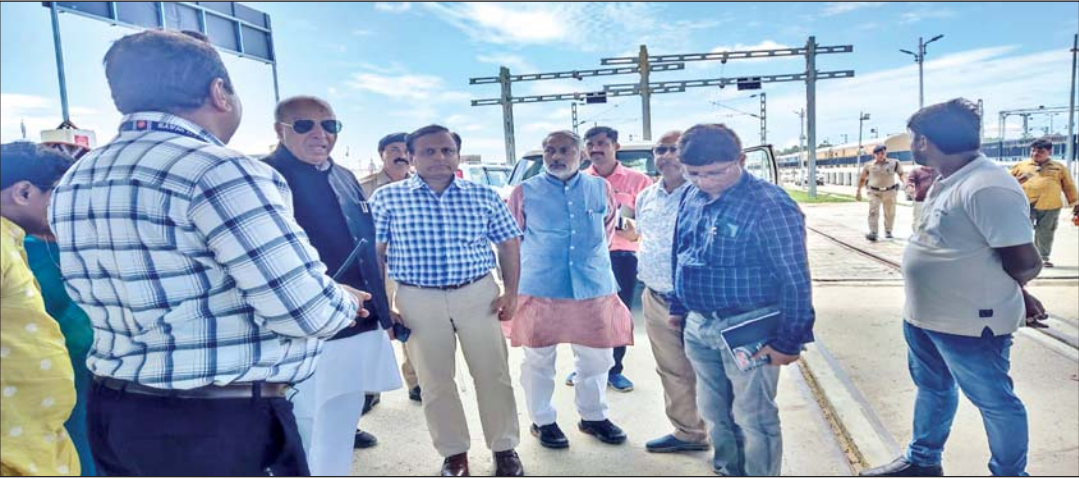
●डीआरएम ने भाजपा सांसद जगदम्बिका पाल के साथ किया निरीक्षण