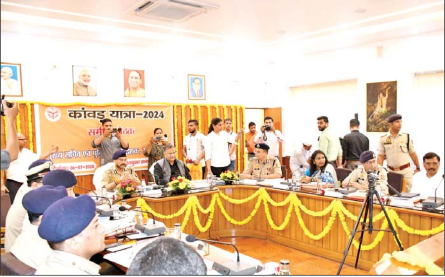
किया गया है। यूपी-उत्तराखंड में बनाए जाएंगे 8 कंबाईड कंट्रोल रूम : मुख्य सचिव