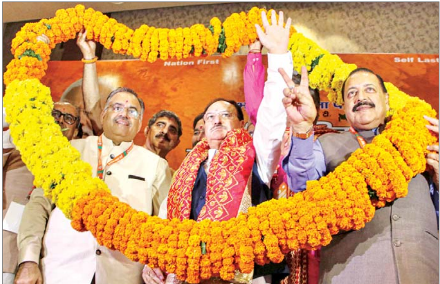
जम्मू- कश्मीर में भाजपा के राष्ट्रीय अध्यक्ष जेपी नड्डा को सम्मानित करते कार्यकर्ता

नयी दिल्ली। रियल एस्टेट कंपनी एम3एम इंडिया को गुरुग्राम में अपनी नयी आवासीय परियोजना से करीब 4,000 करोड़ रुपये की आय की उम्मीद है। कंपनी ने गुरुग्राम में गोल्फ कोर्स एक्सटेंशन रोड पर एक नयी आवासीय परियोजना एम3एम एंटीएल्यूड शुक्र की है, जहां वह 350 विशिष्ट अपार्टमेंट बनाएगी। एम3एम इस चार एकड़ की परियोजना को विकसित करने के लिए 1,200 करोड़ रुपये का निवेश करेगी, जबकि बिंकी से अनुमानित राजस्व करीब 4,000 करोड़ रुपये है। कंपनी इस परियोजना में 10 करोड़ रुपये से लेकर 30 करोड़ रुपये की कीमत वाले अपार्टमेंट बेच रही है।