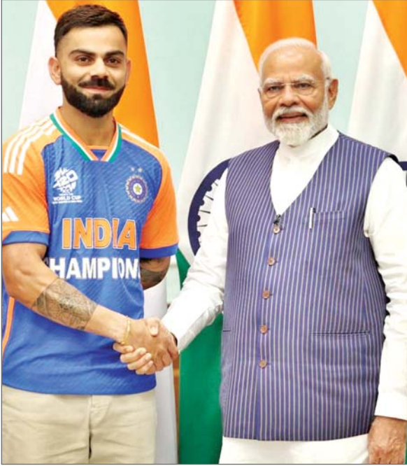
प्रधानमंत्री नरेंद्र मोदी से हाथ मिलाते विराट कोहली

एजेंसी नयी दिल्ली। टी20 विश्व कप जीतकर भारतीय क्रिकेट टीम बृहस्पतिवार को विशेष विमान से स्वदेश लौट आई। लगातार बृंदाबादी के बीच हवाई अड्डे पर प्रशंसकों ने खिलाड़ियों का गर्मजोशी से स्वागत किया और इस दौरान भारी सुरक्षा