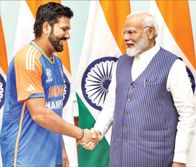
प्रधानमंत्री नरेंद्र मोदी टी-20 वर्ल्ड कप जीतने की बाद कप्तान रोहित शर्मा को बधाई देते