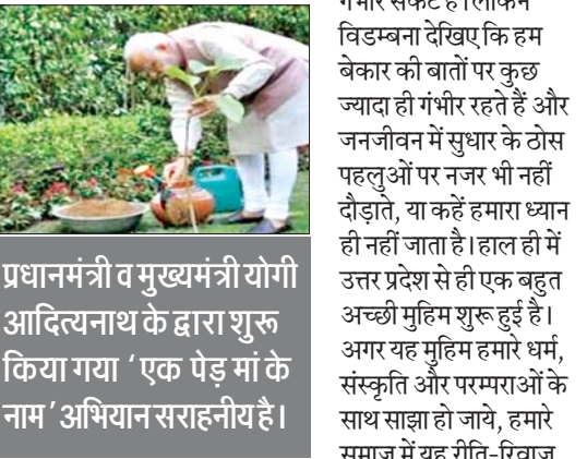
प्रधानमंत्री व मुख्यमंत्री योगी आदित्यनाथ के द्वारा शुरु किया गया ‘एक पेड़ मां के नाम’ अभियान सराहनीय है।

कई बार हम राजनीति में इतना अधिक धंस जाते हैं कि सामाजिक, आर्थिक बदलाव व जनजीवन में व्यापक परिवर्तन के पहलुओं को भी अनदेखा कर देते हैं। हाल ही में केन्द्र में नयी सरकार बनी और संसदीय प्रक्रिया के तहत राष्ट्रपति का अभिभाषण हुआ, पक्ष-विपक्ष के बीच चर्चा हुई और पूरे देश में माहौल गर्म रहा। इंटरनेट मीडिया के बहादुरों ने, इस-उस खेमे से जुड़े चाटुकारों ने माहौल बनाने में कोई कसर नहीं छोड़ी। कुल मिलाकर संसद में विपक्ष ने सरकार पर उल्टे-सीधे आरोप लगाये और बदले में सरकार ने भी विपक्ष पर प्रहार किया। अब इस तरह के संसदीय जनतंत्र से हमारे जन-जीवन में क्या बदलाव आयेगा, किस तरह सामाजिक, आर्थिक और पर्यावरणीय पहलुओं का पोषण होगा, यह शोध का विषय है। लेकिन जिस बात का कोई ठोस वर्थ नहीं है, उसी पर हमारा फोकस रहता है। जबकि पर्यावरणीय संकट के हम ऐसे मुहाने खड़े हैं, जहां हमारा जीवन ही नहीं बल्कि यह धरती और धरती पर जीवन के अस्तित्व पर भी