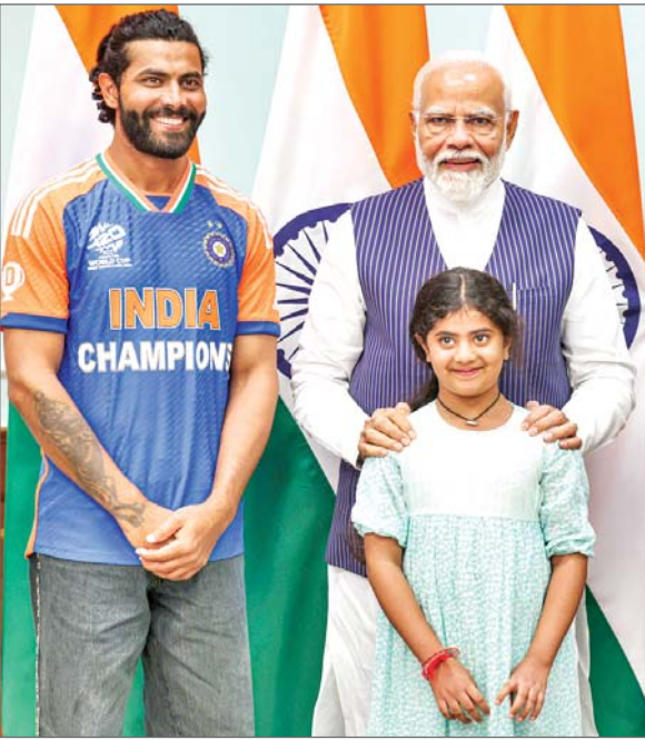
प्रधानमंत्री नरेंद्र मोदी से मिले रविन्द्र जडेजा