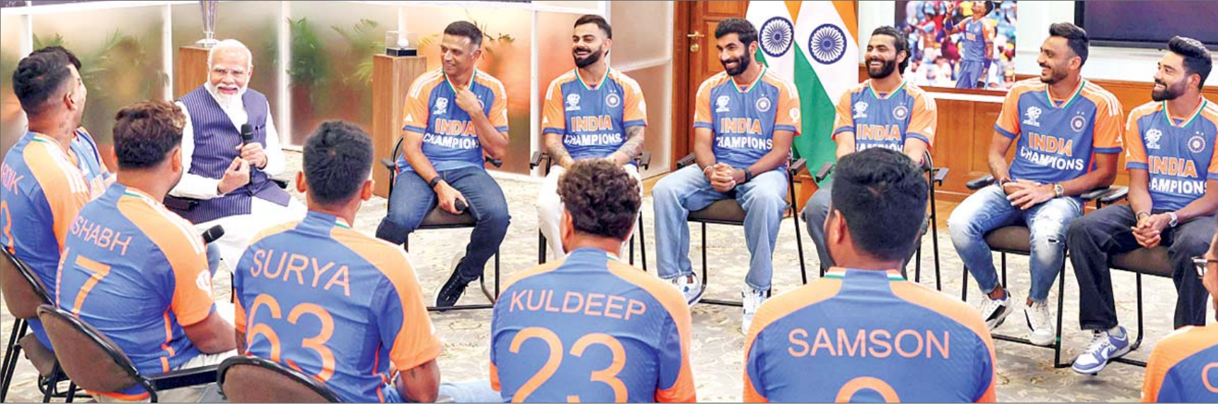
प्रधानमंत्री नरेंद्र मोदी टीम के खिलाड़ियों से बातचीत करते