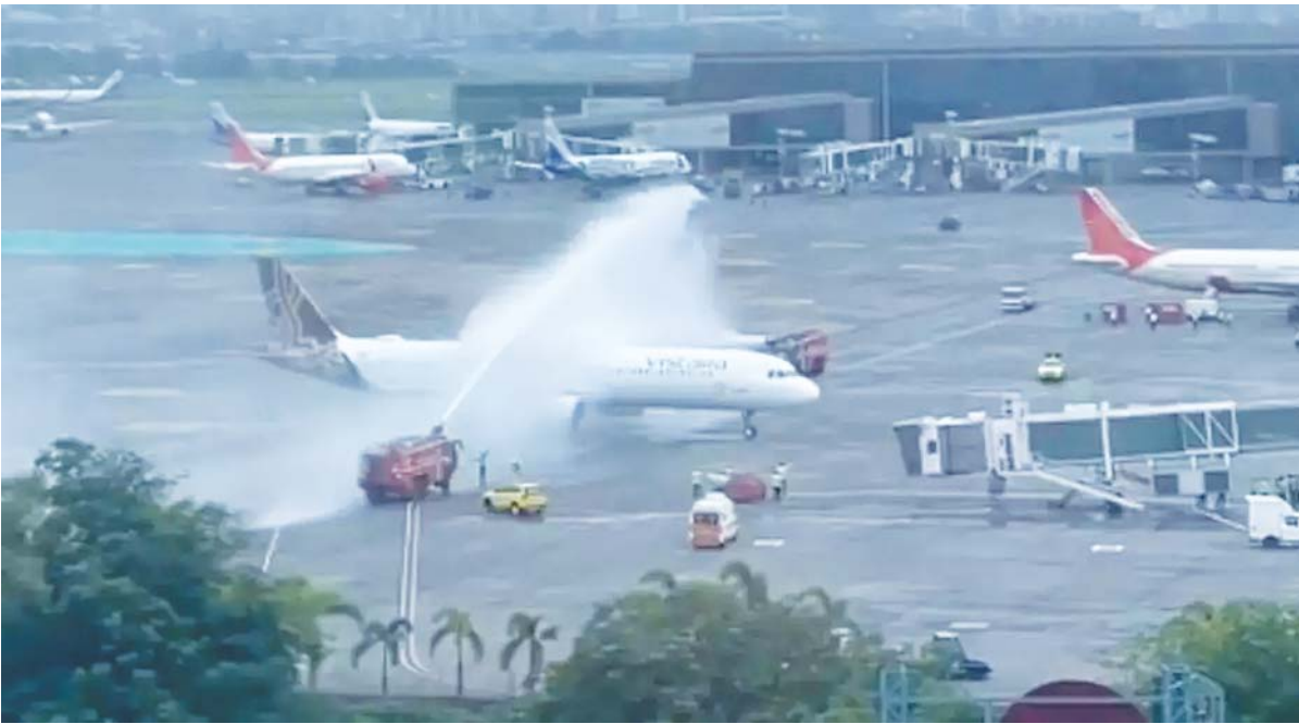
नई दिल्ली में हवाई अड्डे पर टीम इंडिया के पहुंचने के बाद वाटर केनन से ल्यूट देते फायरकर्मी