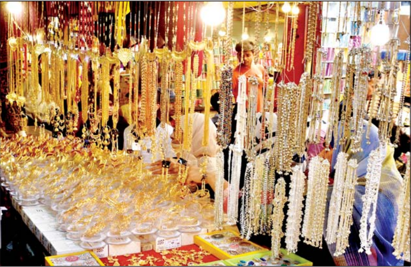
आर्टिफिशियल ज्वेलरी से सजा बाजार