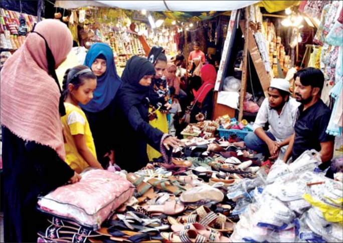
वरिष्ठ संवाददाता (vol)

लखनऊ। मुस्लिम समुदाय के प्रमुख त्योहारों में से एक ईद-उल-अजहा यानि बकरीद सोमवार 17 जून को धूमधाम से मनाया जायेगा। ईद-उल-अजहा पर राजधानी के बाजारों में आज खूब रौनक रही। बाजारों में बकरीद की रौनक देर रात तक छाई रही। अमीनाबाद, मौलवीगंज व नक्खास में लोगों ने खूब खरीदारी की। यहां पर महिलाओं की टोलियां चूड़ियां, कंगन व कपड़ों से लेकर अन्य सामानों की खरीदारी करती दिखीं। वहीं मेहमाननवाजी को लेकर तैयारियां आज भी जारी रही। उधर, कुर्बानी के लिए बकरा मंडी पर खरीदारों की भीड़ उमड़ती रही। खानपान का स्वाद लेने वाले भी देर रात तक बकरीद की रौनक का लुफ्त लेते रहे।