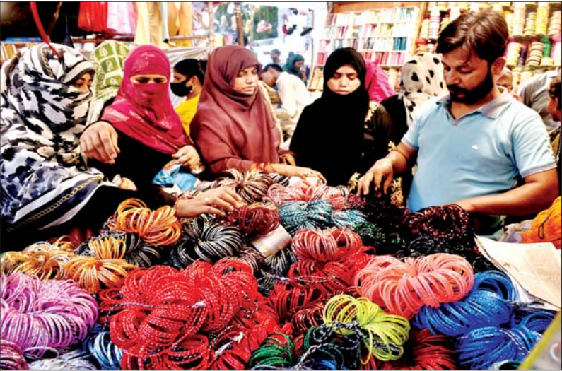
बकरीद को लेकर पुराने लखनऊ में खरीदारी करती महिलाएं