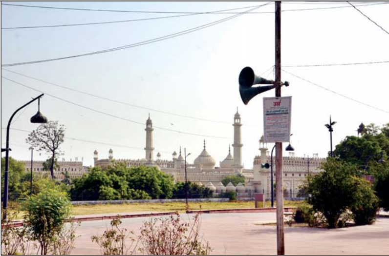
बकरीद की नमाज के लिए शहर के ईदगाह तैयार