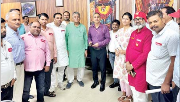
जिला संवाददाता (vol)

टूडला। प्रयागराज में डीआरएम, पीएनएम मीटिंग हुई जिसमें नॉर्थ सेंट्रल रेलवे मेंस यूनियन टूडला की तीनों ब्रांचों के शाखा मंत्रियों ने मंडल रेल प्रबंधक को टूडला के रेल कर्मचारियों की समस्या से अवगत कराया मीटिंग में मंडल रेल प्रबंधक के साथ एडीआरएम व सभी विभागों के शाखा अधिकारी मौजूद रहे।