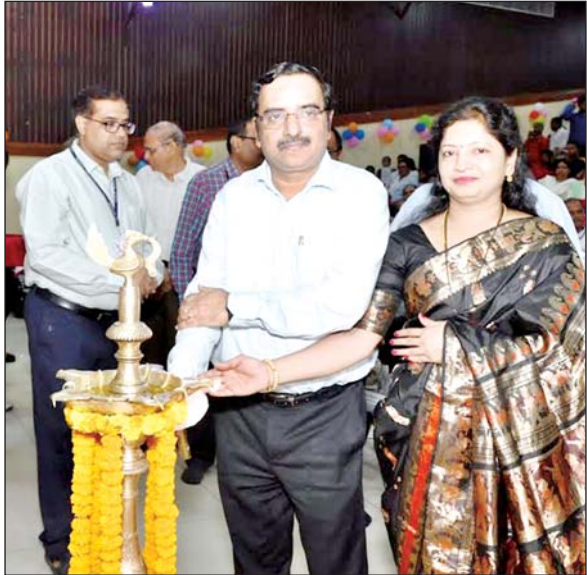
जिला संवाददाता (vol)

अभिभावकों व टीम विंध्याचल के कारण बालिका सशक्तीकरण अभियान को मिली सफलता : एनएस राव