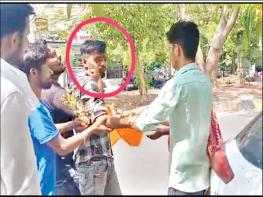
● गला रेतने से पुलिस कर्मियों के हाथ पाँव फुले, घायल को पहुँचाया लोक बधु अस्पताल