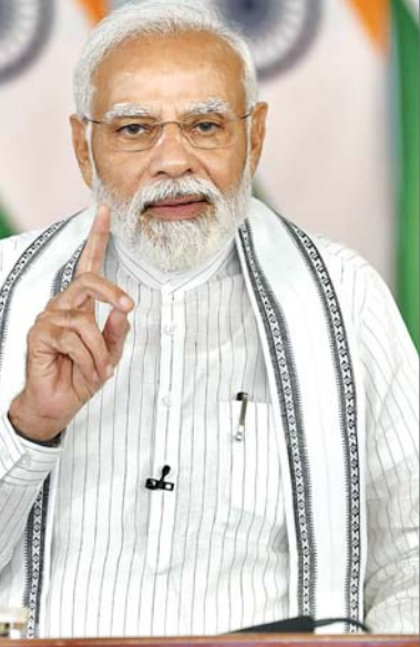
प्रधानमंत्री नरेंद्र मोदी

तिरुपत्तूर। तमिलनाडु के तिरुपत्तूर स्थित एक स्कूल और फिर पार्किंग क्षेत्र में घुसे तेंदुए को वन विभाग की टीम ने रात भर अभियान चलाने के बाद आखिरकार पकड़ लिया। अफसरों ने शनिवार को यह जानकारी दी। वन विभाग की टीम ने शनिवार सुबह तेंदुए को बेहोश करके पकड़ लिया। उन्होंने कहा कि जिल्लाधिकारी कार्यालय के पास स्थित एक स्कूल में अपने बच्चे को लेने पहुंचे एक अभिभावक ने शुक्रवार शाम करीब चार बजे स्कूल परिसर में तेंदुए को देखा था जिसके बाद अधिकारियों को सूचना दी गई। सूचना मिलने के बाद