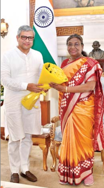
राष्ट्रपति द्रौपदी मुर्मू के साथ अश्विनी वैष्णव

नयी दिल्ली। रेल मंत्री अश्विनी वैष्णव ने शुक्रवार को कहा कि बुलेट ट्रेन सेवा का सुरक्षित परिचालन सुनिश्चित करने के लिए स्वचालित वर्षा निगरानी प्रणाली अपनाई गई है। अश्विनी वैष्णव ने एक्स पर एक पोस्ट में कहा, बुलेट ट्रेन सेवाओं के सुरक्षित संचालन को सुनिश्चित करने के लिए एक स्वचालित वर्षा निगरानी प्रणाली को अपनाया गया है। यह प्रणाली उन्नत उपकरण प्रणाली से सुसज्जित वर्षामापी यंत्रों का इस्तेमाल करके वर्षा पर वास्तविक समय वाले आंकड़े प्रदान करेगी। बुलेट ट्रेन परियोजना कॉरिडोर का निर्माण कर रही नेशनल हाई स्पीड रेल कॉर्पोरेशन लिमिटेड के अनुसार ट्रेक रखरखाव केंद्र ट्रेक के पास स्थापित वर्षा गेज द्वारा उत्पन्न आंकड़ों की निगरानी करेगा। एनएचएसआरसीएल के एक