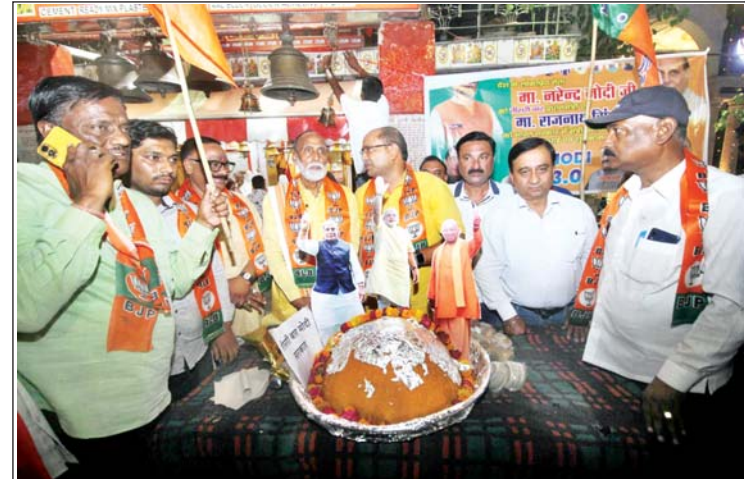
● शहर में निकली रैली, बंटी मिठाई, जमकर हुई आतिशबाजी