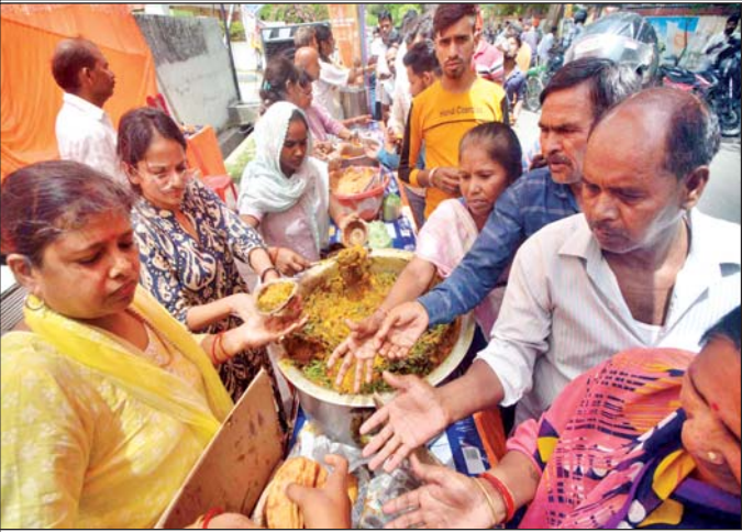
वरिष्ठ संवाददाता (vol)

लखनऊ। ज्येष्ठ माह के दूसरे शनिवार पर भी राजधानी के हनुमान मंदिरों में भक्तों की भीड़ दिखायी दी। सुबह से लगी कतारें देर शाम तक लगी रही। इस मौके पर शहर में कई जगह भंडारे भी लगाये गये। अलीगंज के नए पुराने हनुमान मंदिर और हनुमान सेतु मंदिरों घंटों श्रद्धालु लाइन में लगे रहे। हालांकि नए हनुमान मंदिर में दोपहर बाद श्रद्धालुओं की भीड़ नजर आई और देर रात तक लगी रही।