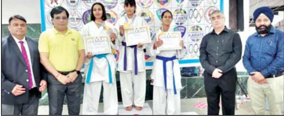
उत्तर प्रदेश स्टेट केडेट, जूनियर, अंडर - २१ व सीनियर कराटे चैंपियनशिप में पदक विजेता