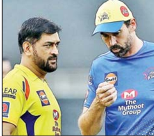
हैं। हमें उनकी उपलब्धियों पर गर्व है। वह टीम के दिल की धड़कन हैं। उनकी मौजूदगी के हर मिनट का हम पूरा आनंद लेते हैं।

लखनऊ। महेद्र सिंह धोनी को चेन्नई सुपर किंग्स के दिल की धड़कन बताते हुए कोच स्टीफन फ्लेमिंग ने कहा कि घुटने की चोट से उबरने के बाद वह लंबे समय तक बल्लेबाजी नहीं कर सकते।ल्लिहाजा शानदार फॉर्म के बावजूद उन्हें बल्लेबाजी क्रम में उअर नहीं भेजा जा सकता। 42 वर्ष के धोनी ने लखनऊसुपर जाईंट्स के खिलाफ शुक्रवार को नौ गेंद में 28 रन बनाये लेकिन उनकी टीम आठविकेट से हार गई। धोनी के फॉर्म के बारे में फ्लेमिंग ने कहा कि यह प्रेरणास्पद है ना। अभ्यास के दौरान भी वह बहुत उम्दा बल्लेबाजी कर रहे हैं। टीम इससे हारन नहीं है क्योंकि सत्र से पहले तैयारी में भी वह शानदार खेल रहे थे। उन्होंने कहा कि उनके घुटने में दर्द है और वह इससे उबरने की प्रक्रिया में कुछ ही गेंद खेल सकते हैं। उन्होंने कहा कि हर कोई उन्हें लंबे समय तक बल्लेबाजी करते देखना चाहता है लेकिन हम उन्हें पूरे टूर्नामेंट में खेलते देखना चाहते हैं। इसलिये दो तीन ओवर खेलना ही ठीक है। वह हर समय अपनी भूमिका बखूबी निभा रहे हैं और उसे देखने में मजा आ रहा है। लंबे समय से चेन्नई के कोच रहे फ्लेमिंग ने कहा कि पांच बार टीम को खिताब दिलाने वाले धोनी टीम के दिल की धड़कन हैं और हर स्टैंडियम पर दर्शकों से उन्हें मिल रहे अपार प्रेम के बीच उनकी मौजूदगी के हर पल का टीम लुफ उठा रही है। उन्होंने कहा , जब वह मैदान पर आते हैं तो क्या जबर्दस्त माहौल होता है। वह भी दर्शकों का पूरा मनोरंजन करते