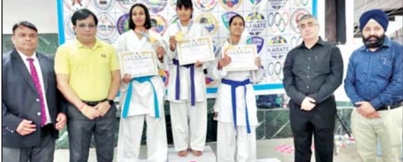
उत्तर प्रदेश स्टेट केडेट, जूनियर, अंडर – 21 व सीनियर कराटे चैंपियनशिप में पदक विजेता