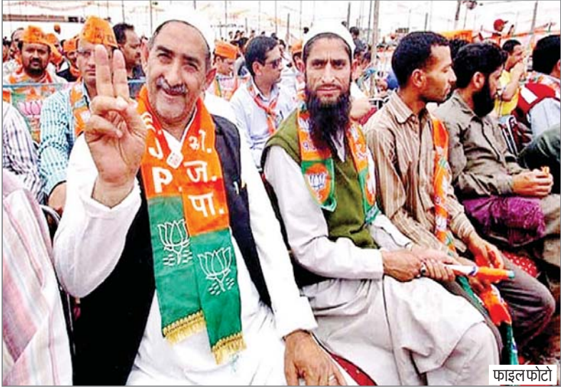
होने में मदद मिलेगी।2014 में केंद्र में मोदी सरकार के आने के बाद और 2017 में उत्तर प्रदेश में योगी