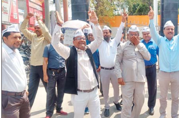
जिला संवाददाता (vol)

रायबरेली। शराब घोटाले के मामले में दिल्ली के मुख्यमंत्री अरविंद केजरीवाल की गिरफ्तारी के बाद जिले में आम आदमी पार्टी कार्यकर्ताओं में आक्रोश फैल गया है। ईडी की इस कार्यवाही पर मोदी सरकार से हम तानाशाही का आरोप लगाते हुए कार्यकर्ताओं ने कहा कि सरकार सरकारी सिस्टम का गलत प्रयोग कर रही है। आप कार्यकर्ताओं ने डिग्री