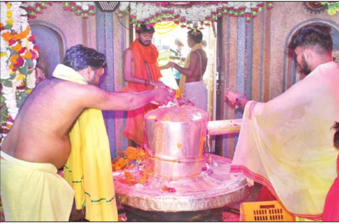
वरिष्ठ संवाददाता (vol)

महाशिवरात्रि पर शिव मंदिरों में कहीं हुआ रुद्राभिषेक तो कहीं महाआरती में उमड़े श्रद्धालु, जगह-जगह भंडारे का आयोजन