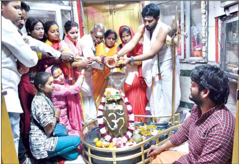
राजेन्द्र नगर महाकाल मंदिर में जलाभिषेक करते श्रद्धालु