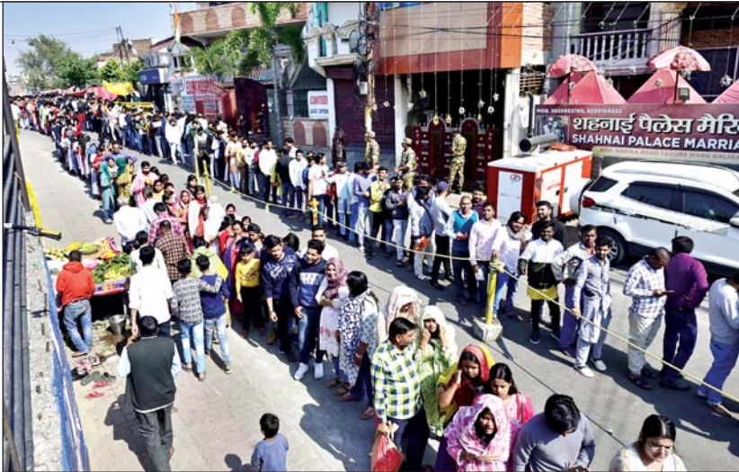
मनकामेश्वर मंदिर में दर्शन के लिए भक्तों की लगी लंबी कतार