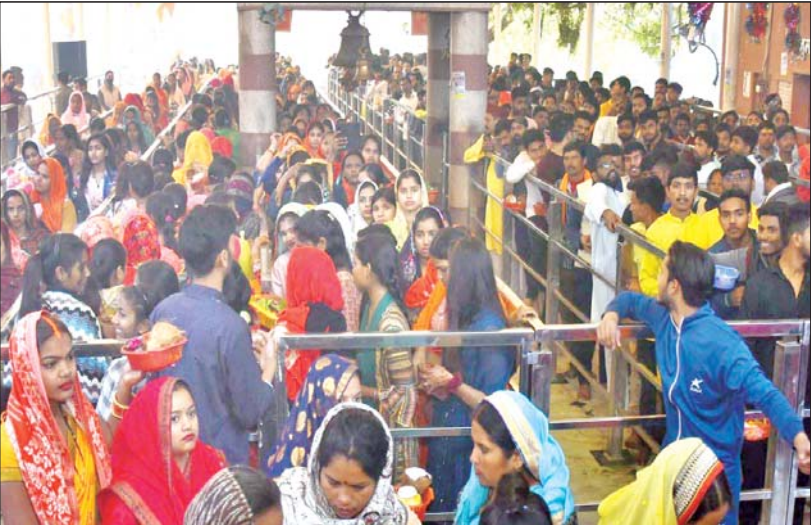
महाशिवरात्रि पर बुद्धेश्वर मंदिर में भोले बाबा के दर्शन के लिए लगी लंबी कतार