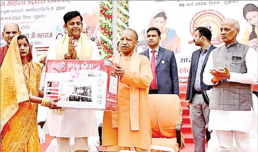
महायोगी गोरखनाथ विश्वविद्यालय में नि.शुल्क सिलाई-कढ़ाईप्रशिक्षण शिविर में महिला को सिलाई मशीन देते सीएम योगी आदित्यनाथ

सीएम योगी शुक्रवार को महायोगी गोरखनाथ विश्वविद्यालय में महाराणा प्रताप शिक्षा परिषद के सौजन्य से आयोजित सात दिवसीय निशुल्क सिलाई-कढ़ाई प्रशिक्षण शिविर में प्रशिक्षु महिलाओं को आत्मनिर्भर बनाने के लिए मुफ्त सिलाई मशीन वितरित करने के बाद अपने विचार व्यक्त कर रहे थे। मुख्यमंत्री, इस विश्वविद्यालय के कुलाधिपति भी हैं।