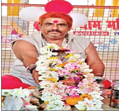
ललितपुर। शुक्रवार को नगर में महाशिवरात्रि का त्यौहार श्रद्धा व

उत्साह के साथ मनाया गया। शिवालयों में दिनभर जल व दूध से अभिषेक के साथ भगवान शंकर की पूजा- अर्चना की गई। रात में भजन-कीर्तन व महाआरती का आयोजन हुआ। श्रद्धालुओं ने व्रत व उपवास रखकर शिवलिंग पर