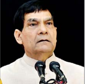
नगर विकास एवं ऊर्जा मंत्री ए.के. शर्मा

लखनऊ। किसानों की खेती की लागत को कम करने और उनकी आय को दोगुना करने के मा. प्रधानमंत्री जी के संकल्प को पूरा करने के लिए मुख्यमंत्री के कुशल नेतृत्व में ऊर्जा एवं नगर विकास मंत्री ए.के. शर्मा ने कहा कि मुख्यमंत्री योगी आदित्यनाथ के कुशल नेतृत्व में प्रधानमंत्री द्वारा किसानों की खेती की लागत को कम करना और उनकी आय को दोगुना करने के संकल्प को पूरा किया जा रहा है। खेती की लागत को कम करने में बिजली का बहुत महत्वपूर्ण योगदान