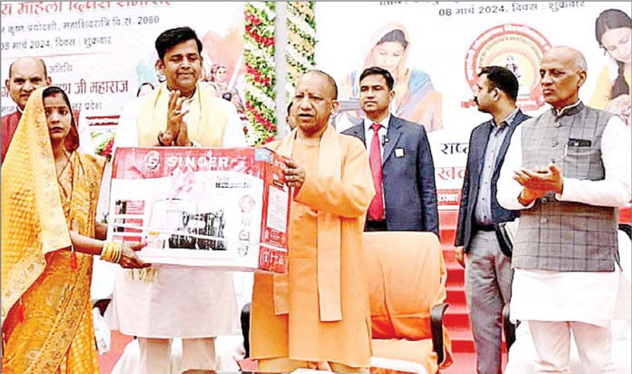
महायोगी गोरखनाथ विश्वविद्यालय में निःशुल्क सिलाई-कढ़ाई प्रशिक्षण शिविर में महिला को सिलाई मशीन देते सीएम योगी आदित्यनाथ

सीएम योगी शुक्रवार को महायोगी गोरखनाथ विश्वविद्यालय में महाराणा प्रताप शिक्षा परिषद के सौजन्य से आयोजित सात दिवसीय निशुल्क सिलाई-कढ़ाई प्रशिक्षण शिविर में प्रशिक्षु महिलाओं को आत्मनिर्भर बनाने के लिए मुफ्त सिलाई मशीन वितरित करने के बाद अपने विचार व्यक्त कर रहे थे। मुख्यमंत्री, इस विश्वविद्यालय के कुलाधिपति भी हैं।