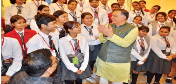
जीडी गोयनका पब्लिक स्कूल के बच्चों को विधानसभा के बारे में जानकारी देते विस अध्यक्ष

मुखिया से अधिक अपने विधानसभा क्षेत्र को संतुष्ट करने की बड़ी चुनौती करना पड़ता है। जीडी गोयनका पब्लिक स्कूल के 30 बच्चों और अध्यापक और अध्यापिकाओं ने विस अध्यक्ष सतीश महाना से मुलाकात के बाद कहा कि उन्हें यहां विधानसभा में आकर बेहद खुशी और गर्व का अनुभव हो रहा है। यहां का भ्रमण हम सभी के लिए आश्चर्य चकित करने तथा प्रेरणा देने वाला है। महाना ने सभी छात्र-छात्राओं सहित विधानसभा भ्रमण पर आने