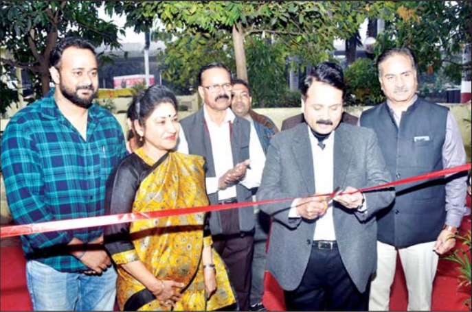
वरिष्ठ संवाददाता (vol)

रवीन्द्रालय चारबाग में कवि सम्मेलन के साथ किताबों का मेला प्रारम्भ, सतरंगी होंगे साहित्यिक और सांस्कृतिक आयोजन